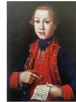
Tomás de Nava y Grimón y Porlier