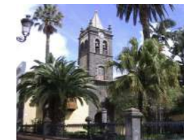
Torre del Convento de San Agustín