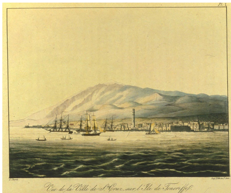
Fig. 1. «Vue de la Ville de St. Cruz sur l'Île de Ténériffe». L. Choris, Vues et paysages (1826). Fundación Canaria Orotava de Historia de la Ciencia

ciudades de Brasil, Chile, las islas Radak, las islas Marianas, Filipinas, Cabo de Buena Esperanza o Santa Elena son algunos de los territorios descritos y dibujados.