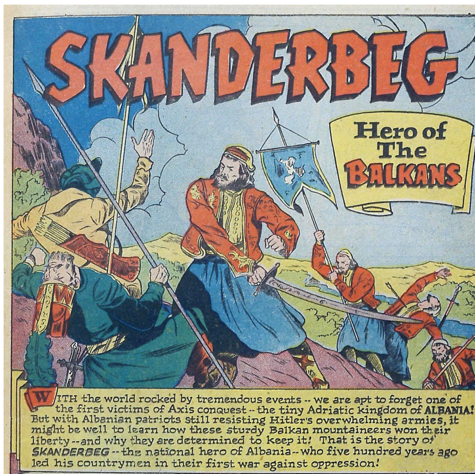
Imagen 1. Skanderbeg. Hero of the Balkans ( Real Life Comics , Septembrer, 25, 1945).