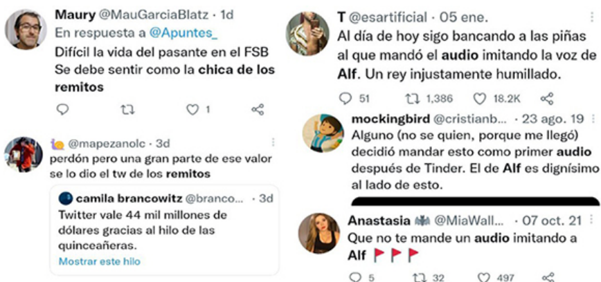
Imagen 1. Referencias culturales internas.

suceso de impacto global o local, en la red social suele verse reflejado por la rápida difusión del tema y la emergencia de tuits vinculados.