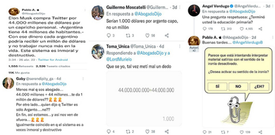
Imagen 2. Incomprensión del enunciado irónico.

reírse de algo 25 . Su éxito está en que los individuos se sientan por encima del producto: la actitud crítica es asociada a la inteligencia y genera satisfacción al ver más allá del mensaje original (Nogués, 2019). Para que se produzca consumo irónico es necesario que el producto sobre el cual se ironiza sea serio, es decir, que no sea un elemento cómico en sí. Al mismo tiempo se requiere una comunidad interpretativa que entienda que el mensaje emitido es irónico. El consumo irónico no deja de ser una forma de consumo y produce que diferentes mensajes, a través de la repetición ecoica irónica, se viralicen y sean consumidos por mucha más gente de la que originalmente hubiese entrado en contacto con él.