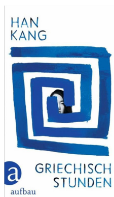
Imagen 1: Portada de la edición alemana de La clase de griego , año 2024.

La obra original en coreano salió al mercado en 2011, y ese mismo año se publicó la traducción al japonés. En Grecia tendrían que transcurrir once años, hasta que finalmente se editó en 2022 la versión en lengua griega. En 2023 se pusieron en el mercado versiones en chino, en español y en muchos otros idiomas occidentales, como el inglés y el francés. En alemán, la primera edición es de comienzos de 2024.