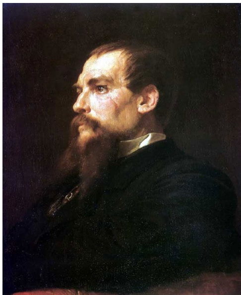
R. F. Burton. Óleo de Frederick Leighton, c. 1872.

hombres, el carácter, la religión, el gobierno y la esclavitud, y a ello añade dos apéndices, el primero sobre comercio y el segundo de carácter documental.