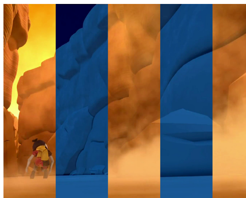
Fig. 7. Code Lyoko (Di Sabatino Christophe y Benoît, 2005). La simplificación de los escenarios 3D derivó en el reciclado de material y la monotonía visual del anime .

La animación 3D gana mucha fluidez en el movimiento de los enemigos y personajes principales. Los movimientos de todas las figuras se sienten más naturales y coordinados. Además, se añade un nuevo sector a Lyoko, el denominado Sector 5, Cartago. Sin embargo, hay un perdedor con la mejora en la calidad del CGI , los fondos y escenarios.