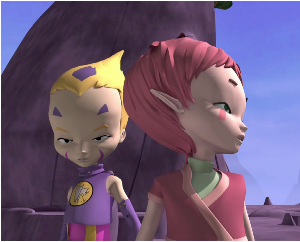
Fig. 5. Code Lyoko (Di Sabatino Christophe y Benoît, 2003). Avatares digitales de Odd (uno de los personajes que forman los Guerreros Lyoko) y Aelita.

Desde el punto de vista técnico, el especial de Los Simpson podemos considerarlo como la primera obra audiovisual en emplear la animación paralela. Sin embargo, y como su nombre lo indica, este fue un capítulo en el que se hizo uso de la técnica de manera puntual y no en la totalidad de su obra.