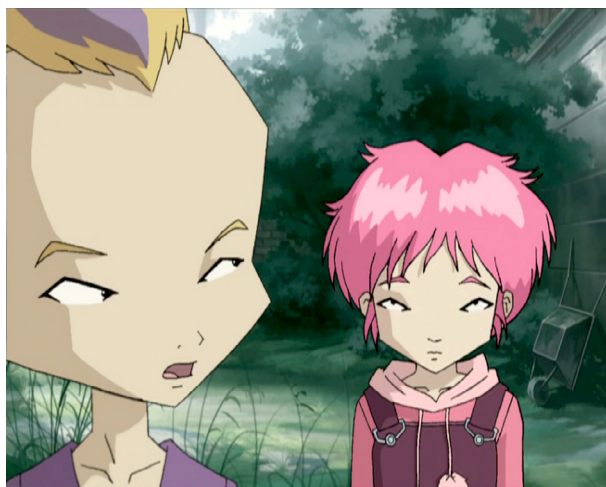
Fig. 4. Code Lyoko (Di Sabatino Christophe y Benoît, 2003). Los protagonistas de Código Lyoko dibujados en formato tradicional.

el caso de Barba Roja (1997). Una integración de técnicas que dan como resultado el modelo 2.5D 15 , muy habitual en videojuegos.