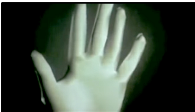
Fig. 2. A Computer Animated Hand (Edwin Catmull y Fred Parke, 1972), la primera animación tridimensional creada por computadora.

Sus trabajos dieron paso a la animación con plastilina utilizada a día de hoy en varios filmes como Coraline , de Henry Selick (2009), y Pesadilla antes de Navidad (1993), imaginada por Tim Burton.