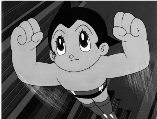
Fig. 1. Astroboy (1963), de Osamu Tezuka, es la animación que sentó las bases del anime como lo conocemos a día de hoy.