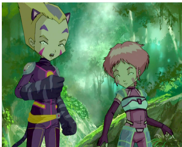
Fig. 8. Code Lyoko (Di Sabatino Christophe y Benoît, 2007). Avatares 3D representados en estilo de dibujo tradicional.

menor que permite al espectador identificar de un vistazo en qué momento cronológico del show se encuentra y la historia que se está contando.